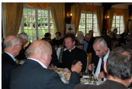
Le repas au restaurant La Croix Blanche