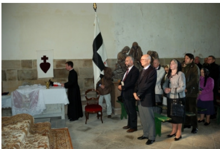
La préparation puis la sortie de la messe à la Chapelle des Martyrs