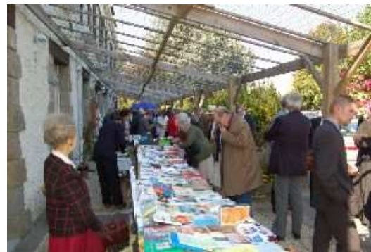
La "galerie marchande"