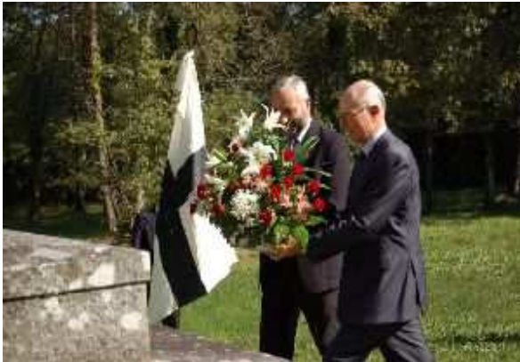
Le dépôt de la gerbe

De nombreux stands permettent, ensuite, à l'assistance de faire provision de bonnes lectures.