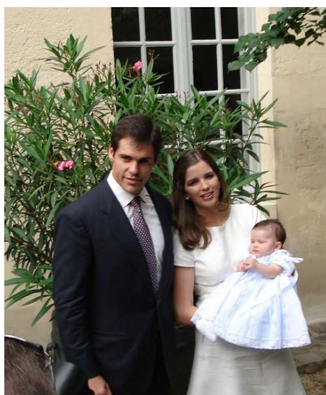
La Princesse Eugénie de Bourbon a été baptisée le 3 juin 2007 à la Nonciature de Paris.

Nous la remercions de nous redonner espoir, et nous assurons ses heureux parents de nos félicitations les plus respectueuses et de notre fidélité renouvelée à une nouvelle génération de Bourbons.